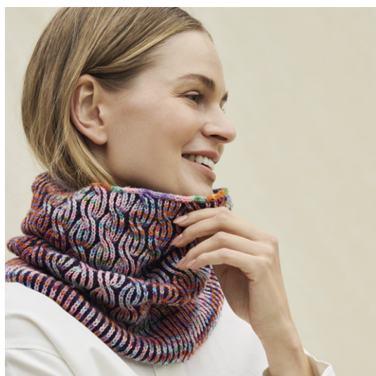
Lana Grossa Meilenweit Merino 1 hand-dyed, 100 g Kailash (Fb 309) und Meilenweit Merino Extrafine, 100 g Aubergine (Fb 2411) .