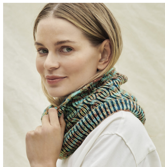
Lana Grossa Meilenweit Merino 1 hand-dyed, 100 g Nanda (Fb 308) und Meilenweit Merino Extrafine, 100 g Blaugrün (Fb 2410) .