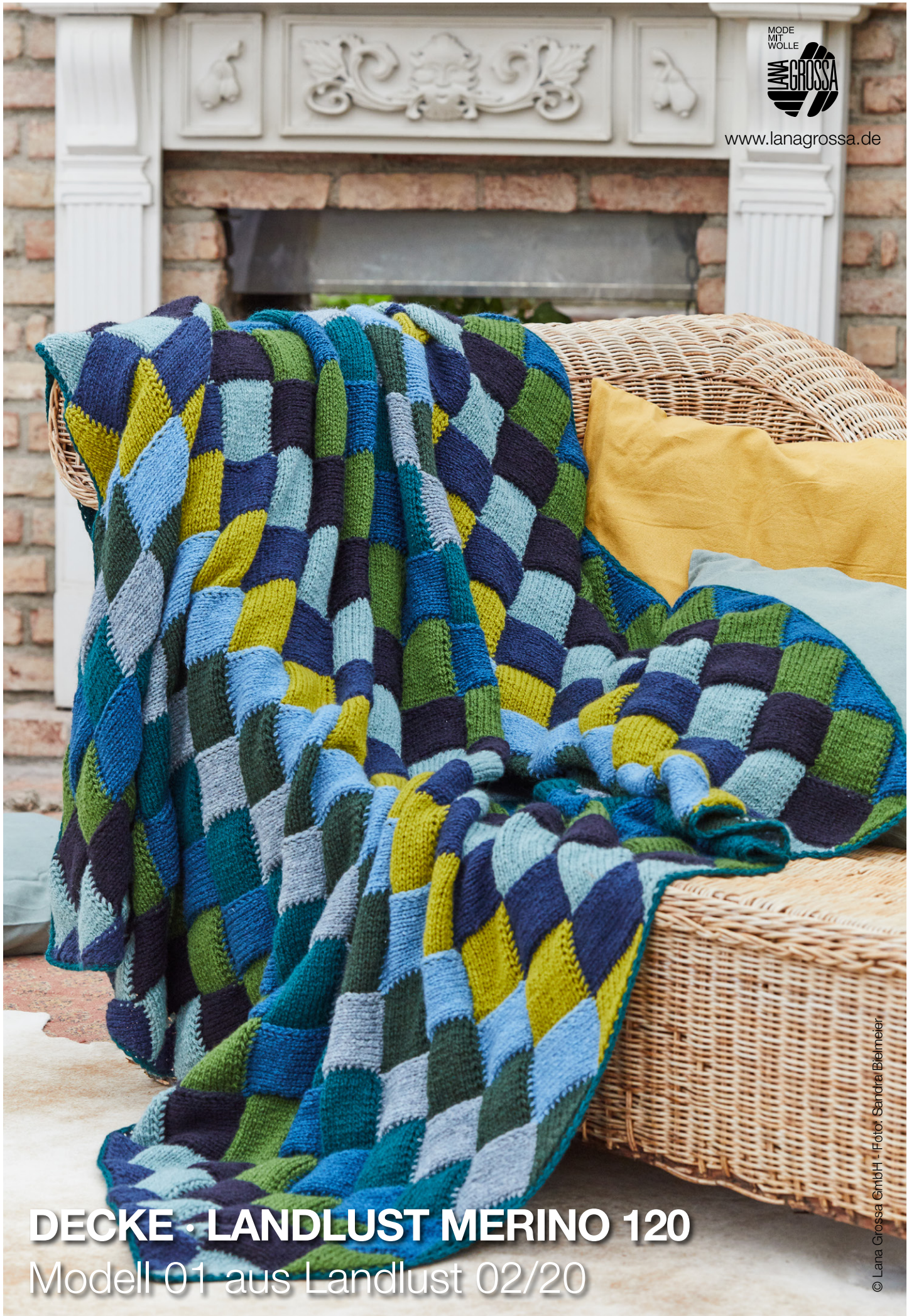
DECKE · LANDLUST MERINO 120 Modell 01 aus Landlust 02/20